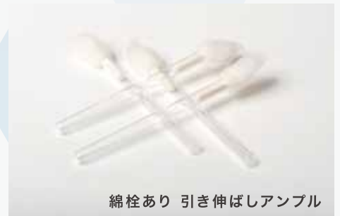
綿栓あり 引き伸ばしアンプル