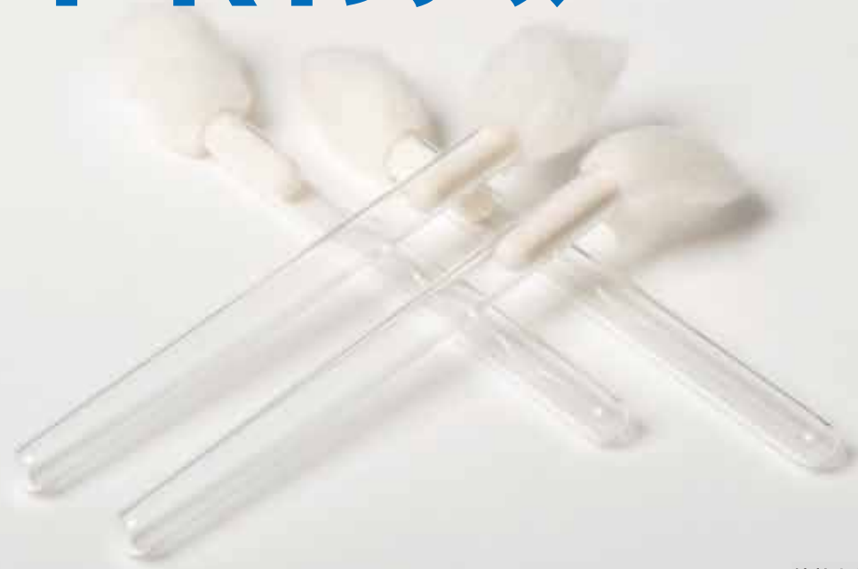
綿栓あり ストレートアンプル