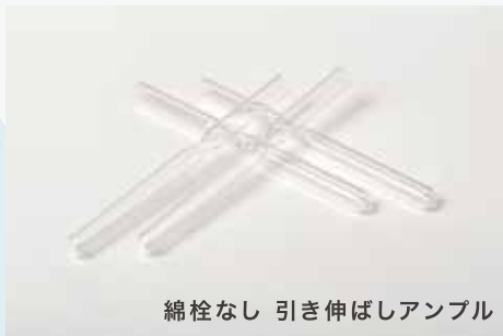
綿栓なし 引き伸ばしアンプル