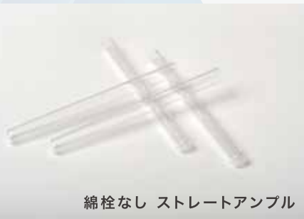
綿栓なし ストレートアンプル